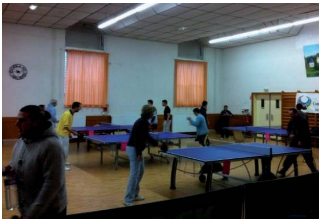
Tournoi de tennis de table