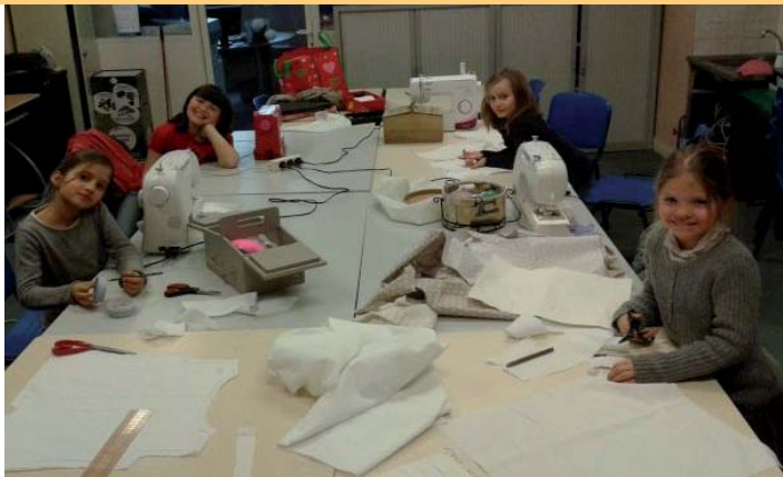
Cours de couture enfant