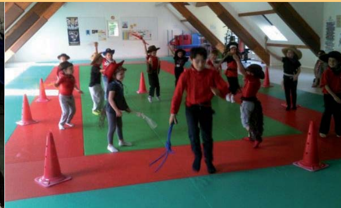
Eveil aux sports