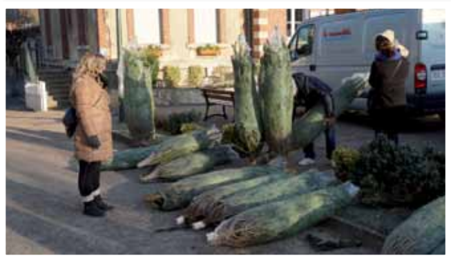
une action de l'APE, la vente de sapins sur le marché de Noël

S i vous avez des enfants à l'école, vous avez sans doute déjà entendu parler de l'Association des Parents d'Elèves (APE). Quels sont exactement son rôle et ses missions ? Qui sont ses membres et comment les rejoindre ? – voici toutes les réponses à vos questions :