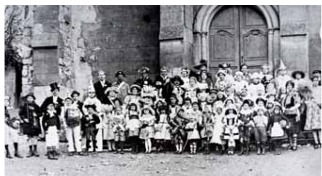
Cavalcade en 1922

Habitants de tous cantons, La digue digue digue, la digue digue don Visiteurs des environs, La digue digue digue, la digue digue don Accourus tous par centaines La brigue don daine Souvenez-vous de l'accueil De Septeuil! (bis)