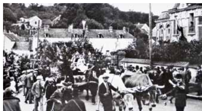
Fête des Fleurs en 1926