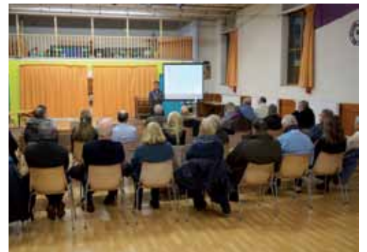
Septeuil Mag n° 19 / Octobre 2018

Le mercredi 19 décembre à 19 heures aura lieu au Foyer Rural une réunion publique d'information et de discussion sur le futur Plan Local d'Urbanisme. Ce document nous concerne tous et conditionne l'avenir de notre ville. La salle est vaste, nous vous attendons très nombreux.